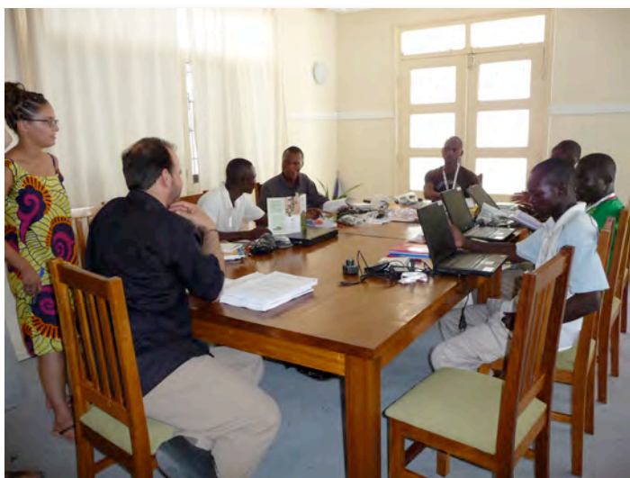
Le centre d'Excellence Sociale

La Radio Communautaire donne une voix aux populations autochtones vivant en forêt ainsi qu'aux populations villageoises vivant en périphérie des concessions forestières de l'entreprise CIB (Congolaise Industrielle du Bois). Grâce à la radio, elles peuvent mieux protéger leurs ressources et échanger des informations vitales avec les différents acteurs régionaux pour la gestion de leur forêts.