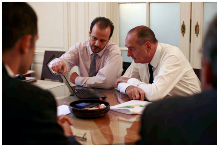
Le Président Chirac lors d'une réunion de travail avec Jérôme Lewis, anthropologue pour le TFT

Soutenir la demande pour du bois certifié dans les pays consommateurs est essentiel pour que les entreprises forestières maintiennent leurs efforts de bonne gestion des forêts.