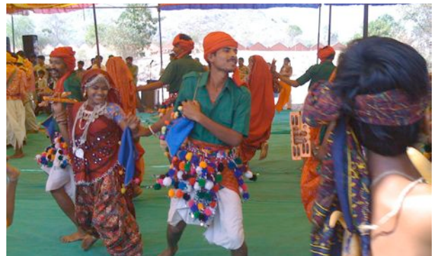
Danses traditionnelles à la Adivasi Academy

L'Inde est en effet un pays culturellement et linguistiquement très riche: 22 langues officielles, 234 langues maternelles reconnues et 1600 dialectes. Des chiffres qui sont pourtant en deçà de la réalité puisqu'aucun véritable recensement linguistique n'a jamais été effectué à ce jour, et que certains experts estiment que le nombre de langues est en réalité supérieur à 1000.