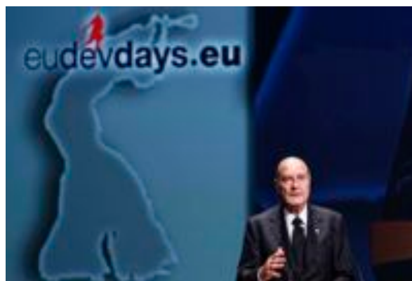
Le Président Jacques Chirac - Journées européennes du développement - 7 décembre 2010

Le Président Jacques Chirac a conclu l'ensemble des Journées par un discours, prononcé devant plus de 1 000 personnes, sur le développement du continent africain.