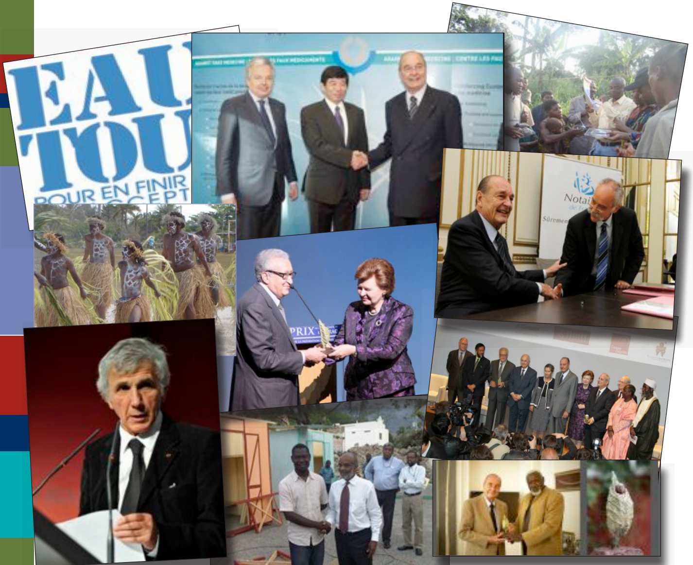
Listes des photographies (de gauche à droite et de haut en bas)

Grâce à l'accueil qu'ont reçu les lauréats du Prix 2010, la prévention des conflits a gagné en reconnaissance auprès du grand public.