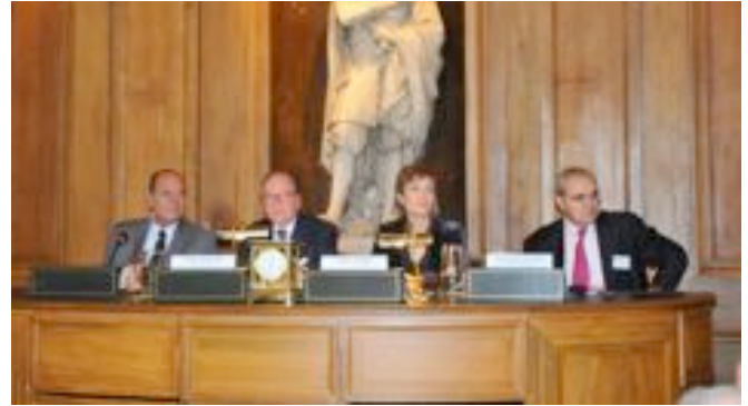
colloque EAU/SUEZ-08/11/2010 @ V.LeTarnec

« L'eau sera toujours un sujet politique qui suscite le débat ; il est naturel que des positions s'affrontent sur la propriété de l'eau, son coût, ou son mode de gestion, mais les discussions de doctrine ne sauraient remplacer l'exigence de l'action et du résultat à atteindre. » Jacques Chirac, discours prononcé le 8 novembre 2010 à l'occasion du colloque « Eau pour tous : pour en finir avec l'inacceptable ».